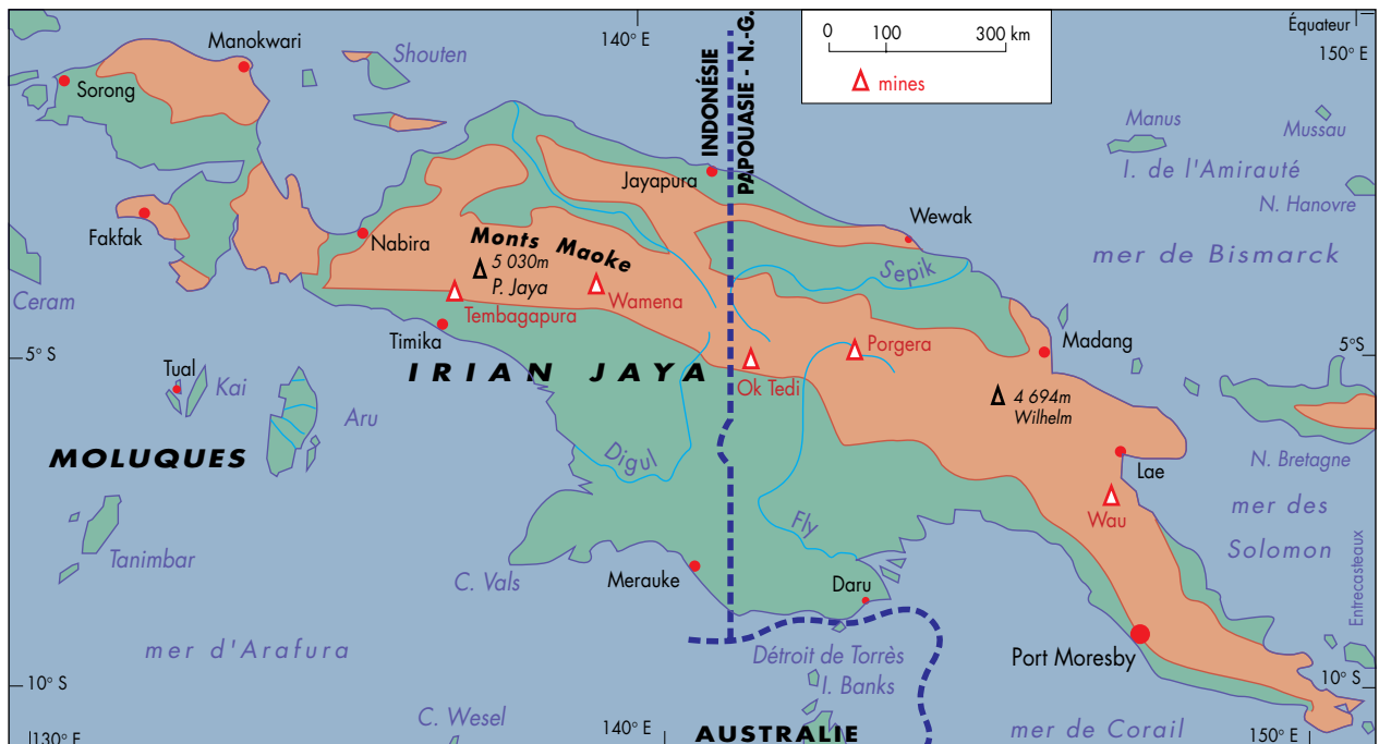
La Nouvelle-Guinée (Irian Jaya)

Si l'on récusé le Groenland, la plus grande île du Monde, au sens commun, serait donc la Nouvelle-Guinée : 786 000 km 2 . Là seulement on peut vraiment commencer à parler d'île, et l'on doit le faire. Ensuite viennent Bornéo (736 000) et Madagascar (590 000), les seules autres îles qui soient plus grandes que la France. La Nouvelle-Guinée est aussi l'île la plus haute du Monde : son sommet, le Puncak Jaya, atteint 5 030 m (3). C'est d'ailleurs bien plus que le Groenland et l'Australie, qui culminent respectivement à 3 700 m (Gunnbjørn) et 2 230 m (Kosciusko). La seule autre île à dépasser 4 000 m est Hawaii (4 205 m au Mauna Kea) ; Taïwan les frise au Hsinkao (3 997 m).