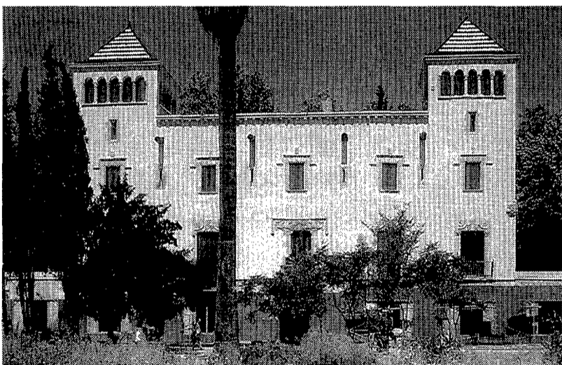
Las imágenes muestran el antes y después de las obras de rehabilitación