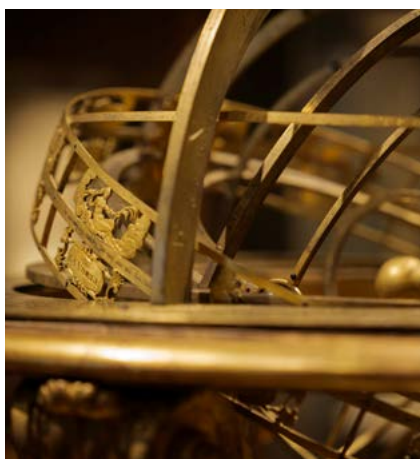
Musée de la BnF

dès lors bien plus qu'une salle de lecture : un lieu de visite et de découverte, ouvert à toutes les expériences, offrant des dispositifs innovants comme l'essayage numérique de costumes, pour un voyage ludique au sein des collections de la BnF.