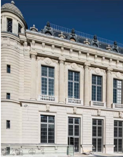
Entrée rue Vivienne

Ce voyage dans le temps raconte l'histoire d'une des plus riches bibliothèques du monde, qui n'a cessé de se transformer et conjugue aujourd'hui sa dimension historique avec son ancrage dans le monde contemporain.