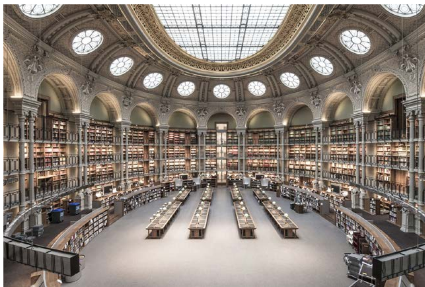
Salle Ovale