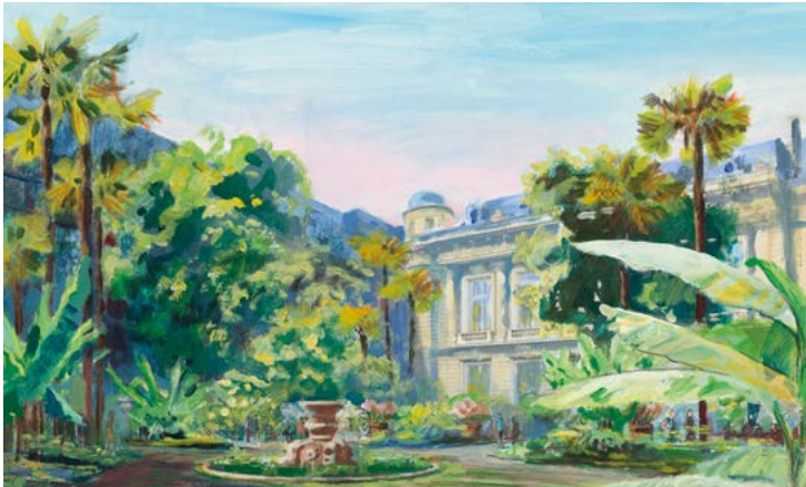
Jardin Vivienne © Gilles Clément

Conçu par le paysagiste Gilles Clément associé à Antoine Quenardel et Mirabelle Croizier, dans le cadre du 1 % artistique, ce jardin ouvert à tous rue Vivienne, valorisera un ensemble de plantes papyrifères connues pour intervenir dans l'élaboration de supports d'écriture et d'impression. Ce projet intitulé « Hortus Papyrifera » est d'autant plus symbolique pour la BnF, lieu de conservation des œuvres sur papier par excellence, qu'il s'inscrit dans une cohérence retrouvée avec l'architecture du palais Mazarin construit par François Mansart.