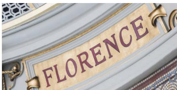
Salle Ovale

Préserver dans les meilleures conditions ses collections inestimables, offrir aux chercheurs un environnement de travail optimal et permettre à chacun de découvrir ce bien commun : telle a été l'ambition qui a prévalu dans la rénovation du site.