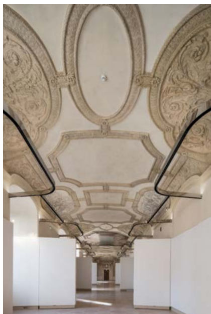
Galerie Mansart