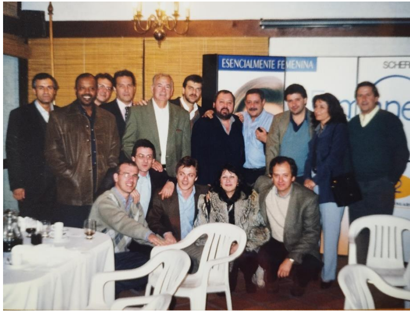
Curs de cirurgia ginecològica a Montevideo (Uruguai), ca. 1990