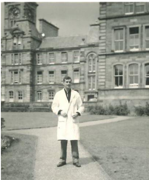
Estudiant al Departament de Ginecologia del Western General Hospital d'Edimburg, 1959