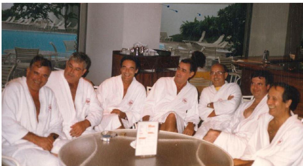
Set catedràtics de ginecologia d'Espanya, després d'una remullada en un congrés a Singapur, ca. 1980

Sí, recerca clínica i, a més de docència i assistència com correspon a un professor universitari. La docència tenia dos vessants: el currículum de la carrera (ensenyament als estudiants) i l'ensenyament als residents. L'assistència ha anat millorant fins a ser moderna i d'un primer nivell. Els parts s'han fet amb tècniques d'analgèsia i d'anestèsia i amb estudis de monitorització fetal electrònica i bioquímica. S'han muntat seccions de sòl pelvià, oncologia ginecològica, menopausa, contracepció i alguna més, que em deixo al tinter, amb publicacions en cadascuna d'elles. Recentment, s'ha assolit el trasplantament de matriu amb resultat de gestació per FIV (Fecundació in vitro) en una pacient estèril i sense úter. S'han organitzat cursos i conferències per a la difusió de tots aquests coneixements amb assistència de molta gent de casa nostra i de fora.