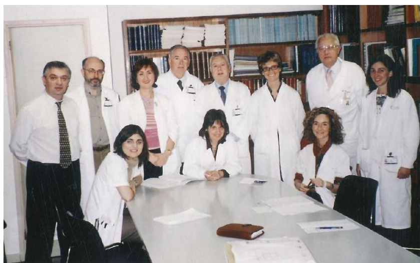
Comitè d'Oncologia Ginecològica a l'Hospital Clínic, ca. 1990

Hauríem d'estar més interessats pels problemes habituals de la nostra societat, no només en l'àmbit de la salut. Si considerem que el metge ha de poder actuar com a consultor i donar consells a la gent, és obvi que no ens hauríem de concretar exclusivament en el camp de la medicina.