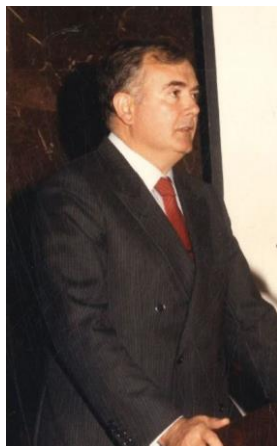
Fent una conferència en un congrés, ca. 1970