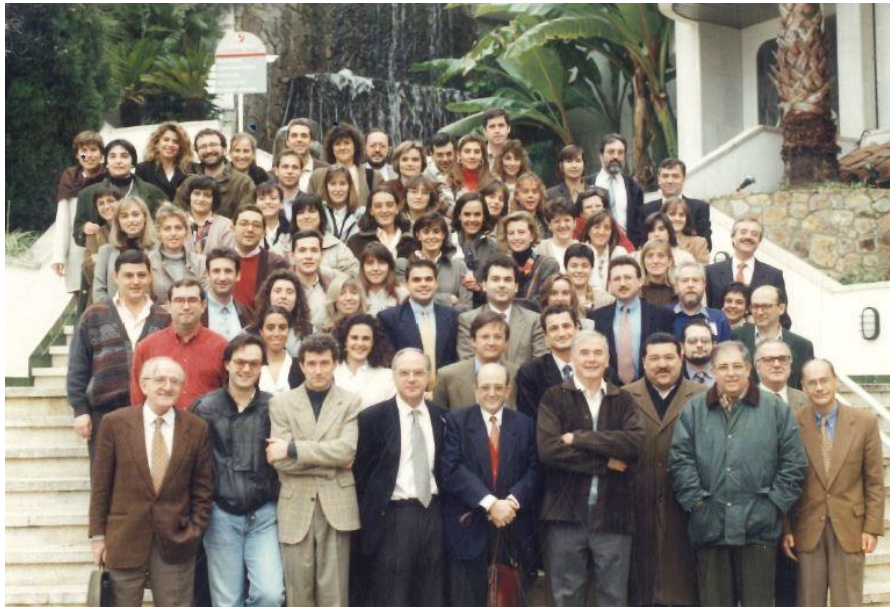
Curs d'oncologia ginecològica a Lloret de Mar, ca. 1990