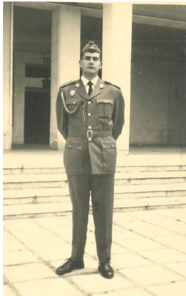
Milícies Aèries Universitàries a Villafría (Burgos), 1958

Normal per aquells temps (1953-1960) amb set cursos, perquè ens afegiren el denominat curs comú. Després de set anys de batxillerat i del temut examen d'Estat. Les assignatures d'aquell curs selectiu eren: matemàtiques, física, química i biologia. Es feia a la universitat - vull dir a la plaça Universitat-, i ens agruparen a tots els que volíem fer medicina, biologia, matemàtiques, física, química, geologia i no recordo si n'hi havia alguna més. La facultat estava feta a l'antiga, és a dir, moltíssima teòrica i poca pràctica. He de reconèixer, però que en vaig sortir ben satisfet.