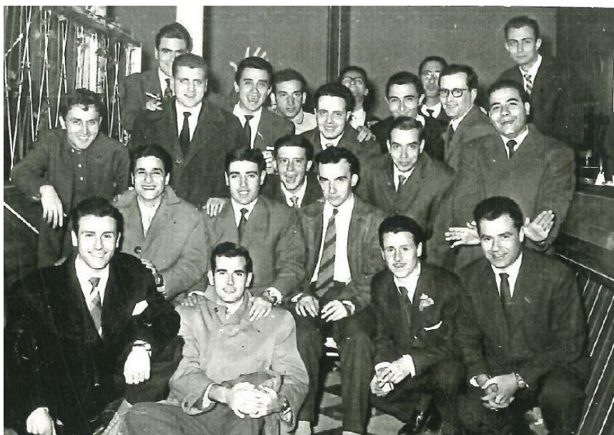
Últim curs de batxillerat al Col·legi de Jesuïtes de Sant Ignasi de Sarrià, 1953

Jo vaig ser fill únic, nascut a Torregrossa, Pla d'Urgell, el setembre del 1936, en plena Guerra Civil. El meu pare era el metge del poble i la casa, cal Anxeco, era una casa antiga que vivia de l'agricultura. La zona era rica, perquè es regava amb el canal d'Urgell, a diferència de les zones properes de secà com, per exemple, les Garrigues. Tot i viure la postguerra, tinc un molt bon record de la meva infantesa i mai em va faltar de res.