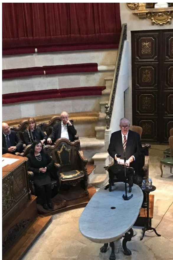
Conferència "La ginecologia, a través de dues generacions" al Teatre Anatòmic de la Reial Acadèmia de Medicina de Catalunya, 16 d'abril de 2018

Crec que ser metge és una vocació i, per tant, els que hi entrin ho han de tenir molt en compte. S'ha de guanyar per viure, però el més important és sentir-se metge,