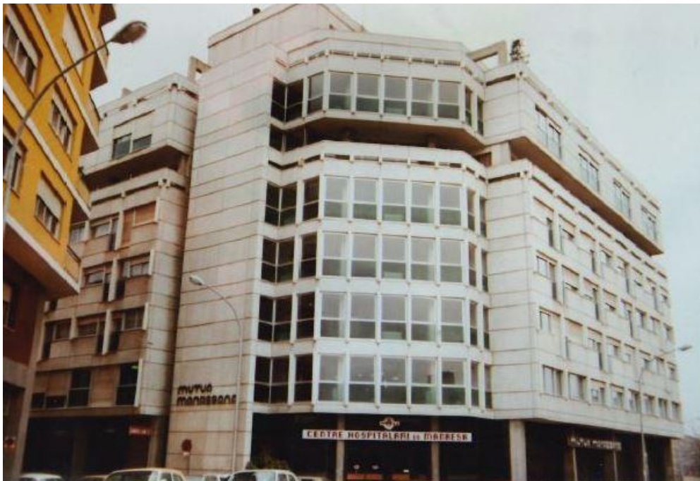
Façana del Centre Hospitalari de Manresa, on Francesc Sant Figueras més anys ha treballat