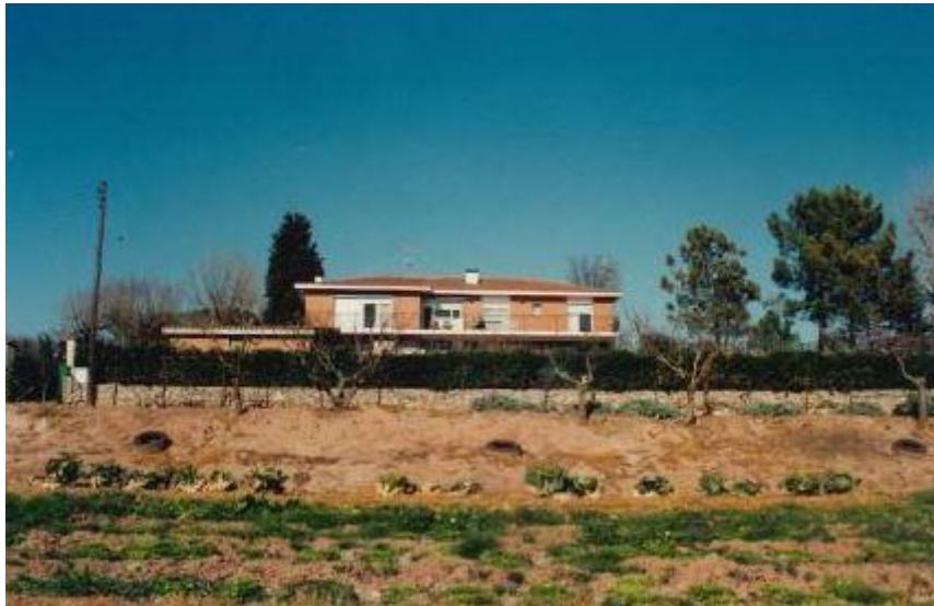
Casa familiar a tocar el Parc de l'Agulla a Manresa