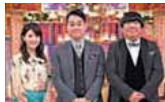
「沸騰ワード10」 11.2% 毎週金曜日 19:00~19:56放送