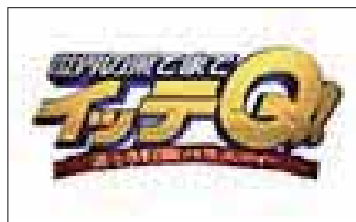
「世界の果てまでイッテQ!」 19.3% 毎週日曜日 19:58~20:54放送