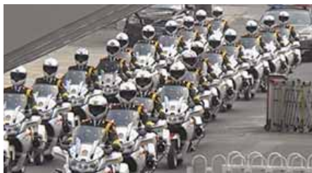
ナンバーのない車を先導する異様な数の白バイ