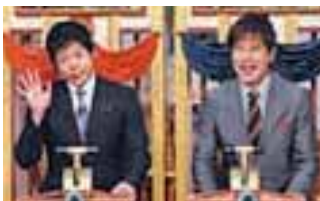
「人生が変わる1分間の深イイ話」 13.1% 毎週月曜日 21:00~21:54放送