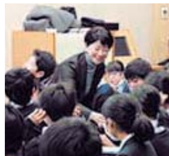
平成30年1月、神奈川県内の中学校にて。豊田順子アナウンサーが「正確に伝えるためのプロの視点・技術を披露しました。