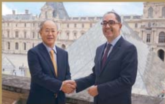
2017年7月 日本テレビ大久保社長(左)とルーヴル美術館マルティネス館長(右) フランス・ルーヴル美術館にて調印の様子

L'art du portrait dans les collections du Louvre