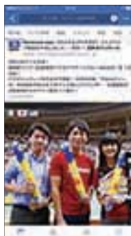
Facebookでのグラチャン 試合前ライブ配信。

2017年6月に、オールアバウト子会社のオールアバウトナビが、日本テレビの関連会社となりました。オールアバウトナビは、Facebook上で国内最大級のフォロワー数約440万人を持つ「Facebook navi」やミレニアル世代に向けたショート動画メディア「チルテレ」、SNS配信型ウェブメディア「citrus」を運営しています。これらのメディアを活用し、日本テレビの持つコンテンツ資産をソーシャルメディア上で流通させることで、新たなファン層やネット広告収益の獲得を目指します。