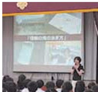
平成29年6月、東京都内の中学校にて、「事実を確かめるにはどうすれば良いの？」をテーマに、200人の中学生が活発に議論しました。

日本テレビは、昨年、新しいCSR活動である出張授業「情報の海の泳ぎ方」をスタートさせました。報道記者の経験を持つスタッフやアナウンサーが学校に出向き、インターネット時代において「正しい情報をどう見極めるか」を生徒と一緒に考える内容で、今年4月現在で8回実施しました。10年以上の実績を誇る「日テレ体験教室」（テレビ制作の第一線で働く技術スタッフが中継や編集の仕組みを実演を交えて見せる出張授業）と共に、メディア企業としての社会貢献を進めています。