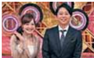
「有吉ゼミ」 14.1% 毎週月曜日 19:00~20:00放送